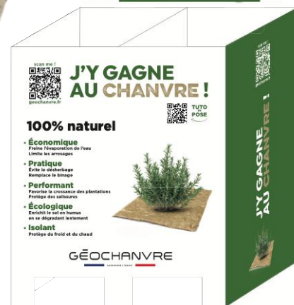
Photo box non contractuelle